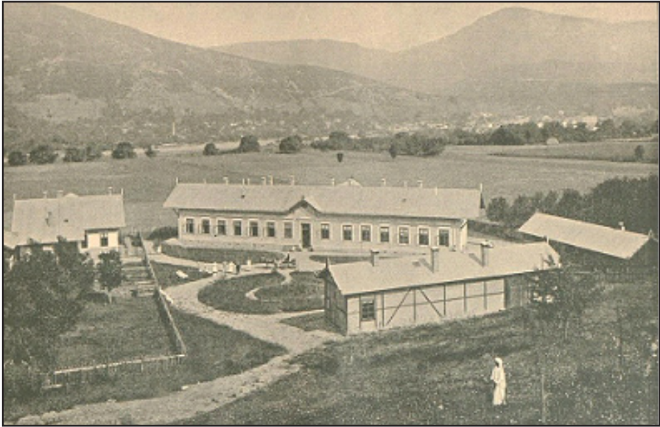
Prilog 2. Okružna bolnica u Gorazdu