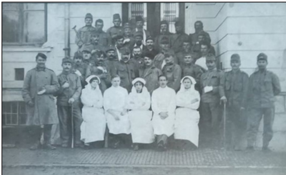
Prilog 3. Osoblje i pacijenti Ortopedskog zavoda 1915. godine (preuzeto iz: Stojnić Bojan, Zavod za fizikalnu medicinu i rehabilitaciju „Dr Miroslav Zotović“: 100 godina prve ortopedije u Banjaluci , Banja Luka 2015, 15)

U okviru Zavoda obavljani su i hirurško-ortopedski zahvati. Međutim, većina ratnih invalida, skoro 98%, apriori je odbijala predloženu operaciju. Jedino su pacijenti s fistulama na zglobovima pristajali na operativni tretman, jer s podgnojenom ranom nisu mogli biti otpušteni. I pod prijetnjom premještenja ili kaznene prijave pacijenti nisu mijenjali mišljenje i bili su spremni da snose sve posljedice. Glavni razlog tako tvrdokornog stava bio je taj što su vojnici dolazili u Zavod skoro godinu dana nakon ranjavanja, umorni od liječenja i straha da će im operativni zahvat produžiti otpust. Ipak, u 1916. izvršeno je 59 operacija, a 28 u prvoj polovini 1917. godine. Brojni pacijenti premješteni su u gradske bolnice, jer Zavod nije imao aseptične sobe, niti opreme za složenije operacije. Uglavnom su se izvodile sekvestrotomije, kako bi kod pacijenata zacjelile fistule, te reamputacije. 93