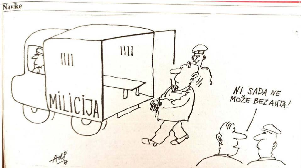
Ilustracija 1. Oslobođenje 14174, 5. decembar 1987.

Pod ovakvim snažnim pritiskom javnosti partijsko rukovodstvo nastojalo je definirati jasne smjernice za izlazak iz, ne više samo „teške i složene situacije“ kako se do tada eufemistički isticalo, već očigledne ekonomske, političke i društvene krize. Trostruka reforma (politike, privrede i Partije) kao i demokratizacija sveukupnih društvenih odnosa i političke prakse akcentirana je kao prioritet pri čemu je vrlo važnu ulogu trebala imati i demokratizacija kadrovske politike. 9 Ona je, kao ključna pretpostavka, efikasnog djelovanja političkog sistema pretpostavljala podruštvljavanje i demokratizaciju izbora, imenovanja i postavljanja kadrova i jačanje njihove lične i kolektivne odgovornosti. Pod tim se pretpostavljalo u prvom redu uvođenje novog, neposrednog načina izbora s više kandidata na listama, tajno glasanje, napuštanje prakse jednogodišnjeg mandata, podmlađivane rukovodstva, uz istovremeno dokidanje pojave „vječnih rukovodilaca“ i „preplate na