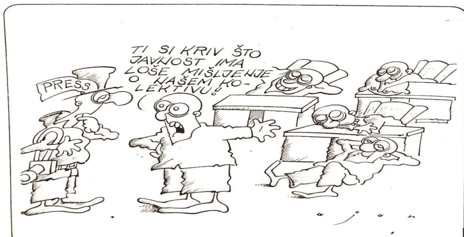
Ilustracija 3. Oslobođenje 14301, 12. april 1988.

Ovaj dokument, podijeljen u 32 tačke, uz konstataciju o teškoj aktualnoj političko-ekonomskoj situaciji i evidentnom „odstupanju od klasno-revolucionarne politike Saveza komunista“, činili su zahtjevi, sugestije, prijedlozi, smjernice, upozorenja i ukazi CK. Zahtijevana je promjena „odnosa u vlastitim redovima i demokratizacija ukupnog društvenog i političkog života“ pri čemu je, kako je bilo istaknuto, trebalo „ojačati sposobnost SK da nudi i prihvata novije, progresivnije ideje i inicijative“. U prvom redu trebalo je značajno promijeniti praksu i smanjiti administrativni aparat, provesti sveopću štednju koja je podrazumijevala veliko smanjenje troškova reprezentacija, različitih proslava, voznog parka i slično. Također, trebala se izmijeniti i dotadašnja stambena politika i politika izgradnje. Tražila se efikasnija primjena akcije „imaš kuću vrati stan“ koja je trebala dokinuti očigledno prisutnu praksu raspolaganja sa dva ili više društvenih stanova, te raspolaganje društvenim stanovima uz posjedovanje vlastite kuće ili stana. Sve to trebalo je pomoći borbu protiv zloupotrebe javnih i poslovnih funkcija, postojećih socijalnih razlika pri čemu se trebalo sprovesti ispitivanje porijekla imovine pa i njena konfiskacija. Diferencijacija s onima za koje se utvrdi da su činili nezakonite radnje, prema ovom dokumentu, trebalo se kategorično provesti u svim organizacijama i organima uključujući i najviše partijsko rukovodstvo. Bilo je istaknuto da Konferencija SKBiH