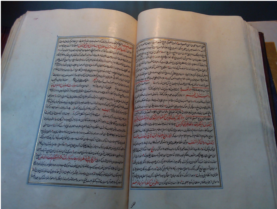
Narativ o epizodi Hadži Ilbегоve pobjede HR-HDA-750. Obitelj Ottenfels, Hešt bihešt , no. 2, 142b-143a